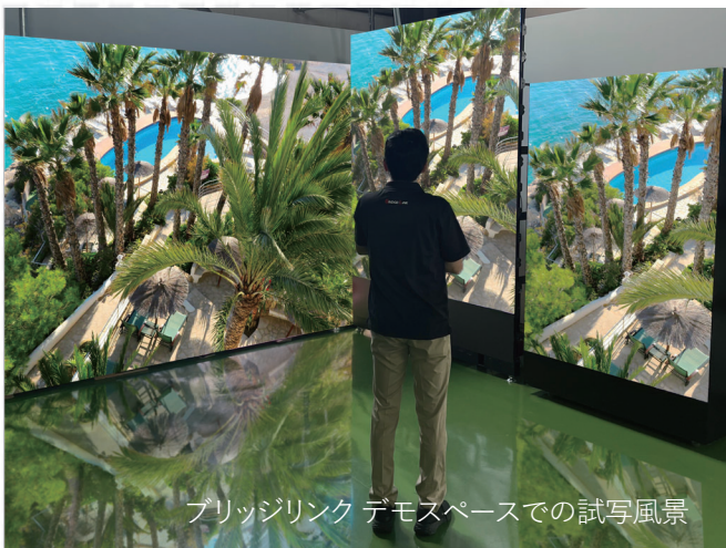
ブリッジリンク デモスペースでの試写風景